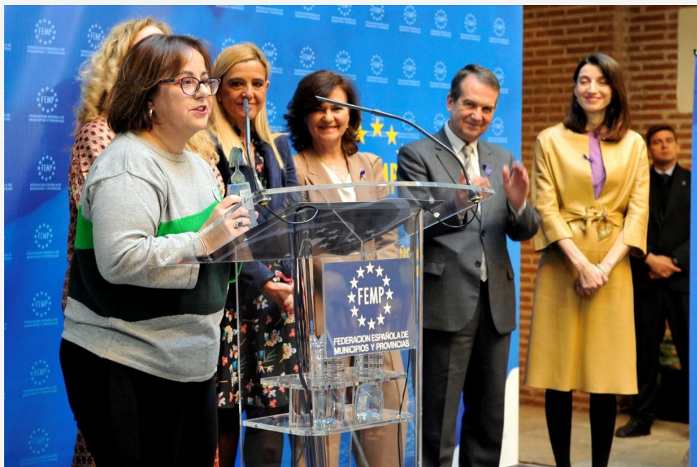
La Concejala de Igualdad recogiendo el premio en la sede de la Femp

la Secretaría de Estado de Igualdad ha otorgado al Consistorio por las medidas llevadas a cabo en materia de prevención de la violencia de género. Se trata de la sexta edición del Concurso de Buenas Prácticas Locales contra la Violencia de Género, en la que se ha puesto en valor el trabajo realizado en materia de “Sensibilización y Prevención” por la campaña “ Ligar no es ob-ligar ”.