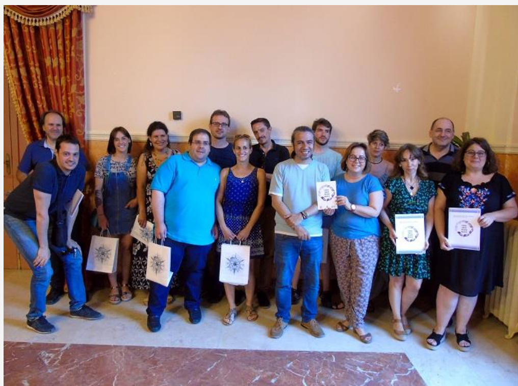
Taller de Espacios Libres de Violencia Machista