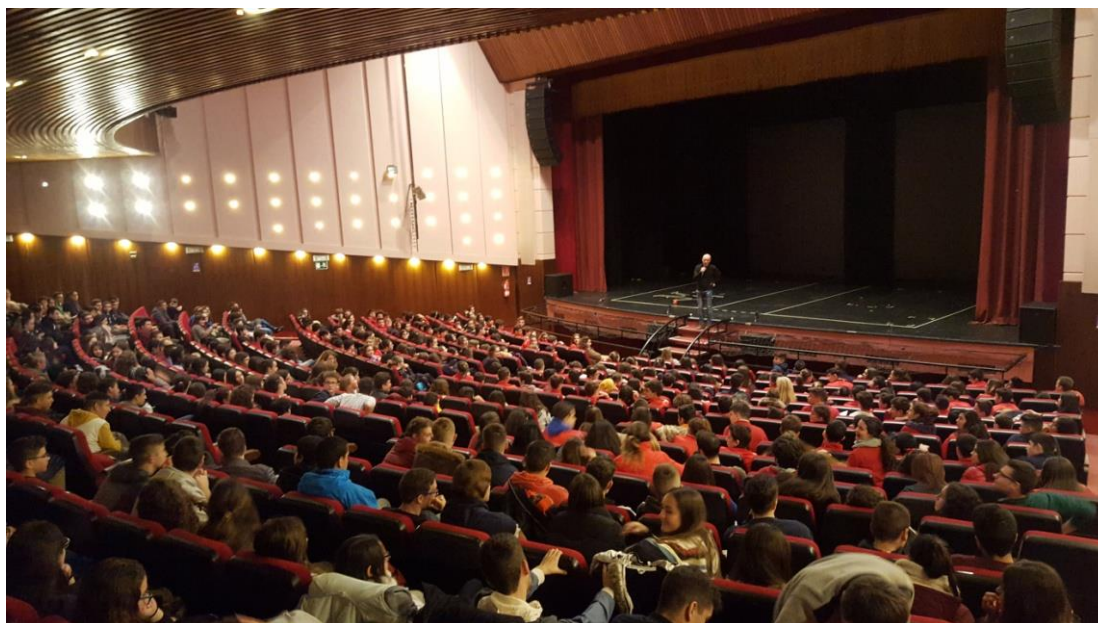
Público asistente a la representación de la obra “Don Juan”

Coincidiendo con la Programación contra la Violencia se realizó la Campaña “EDUCAR EN IGUALDAD” que consiste en la realización de TALLERES DE SENSIBILIZACIÓN Y PREVENCIÓN DE LA VIOLENCIA DE GÉNERO destinados a la Comunidad Educativa