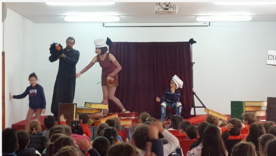
Teatro Cuenta Cuentos en la II edición de Educar en Igualdad