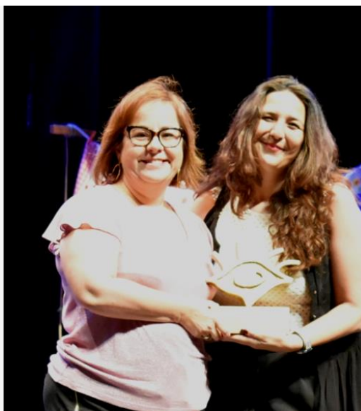
La Concejala de Igualdad entregando el premio a la Mejor Directora

Tanto en la Pandorga como en la Feria de Agosto se han llevado a cabo campañas de sensibilización y prevención de agresiones sexistas en las fiestas de la ciudad. Se han instalado los llamados “PUNTOS DULCINEA” atendidos por voluntarios de dos asociaciones APROI y USAWA (Mod. Igualdad del Instituto de Educación Secundaria “Atenea”) también han colaborado el Colectivo Espinas que facilito un teléfono de emergencia y la Asociación WADO que lleva a cabo una campaña ante posibles actos homófobos. (EJE 3: PREVENCIÓN DE LA VIOLENCIA DE GENERO del II Plan de Igualdad)