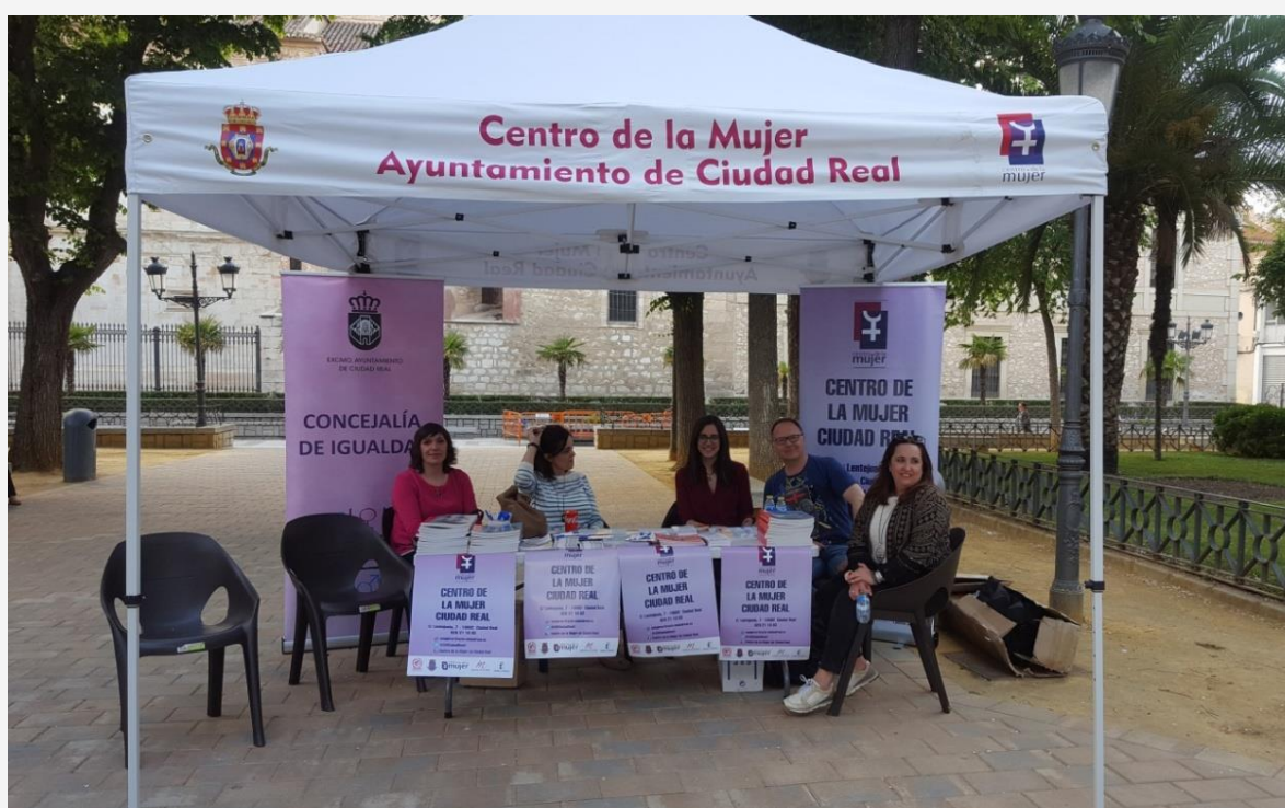
Personal de la Concejalía de Igualdad y del Centro de la Mujer en el punto informativo que se instalo en las Jornadas de Clausura