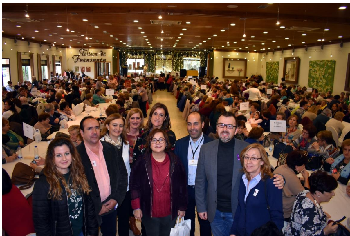
X Encuentro de Encajeras y tradiciones Populares