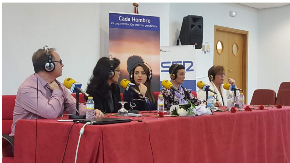
Durante el Programa emitido por la Cadena Ser, titulado "TERTULIA POR LA IGUALDAD",