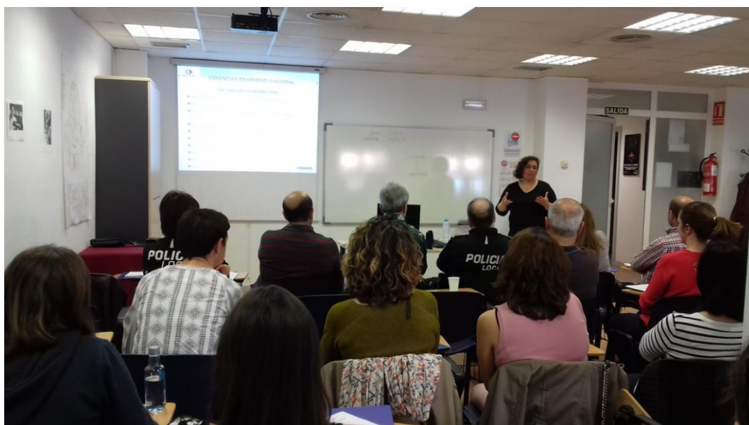
Curso Violencia de Género en contextos de Vulnerabilidad

A continuación se exponen las distintas acciones que se han desarrollado de este II Plan de Igualdad entre Mujeres y Hombres en el Municipio de Ciudad Real durante este año 2018, y el resto de actividades programadas desde la Concejalía.