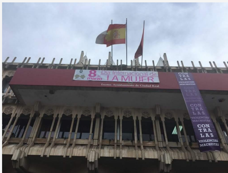
Balcón del Ayuntamiento luciendo la Pancarta del día 8 de Marzo Día Internacional de la Mujer y otra contra las violencias machistas