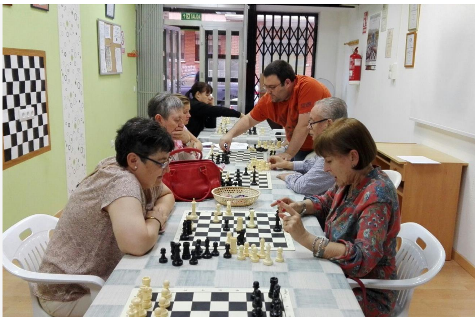
Grupo de Ajedrez practicando la actividad