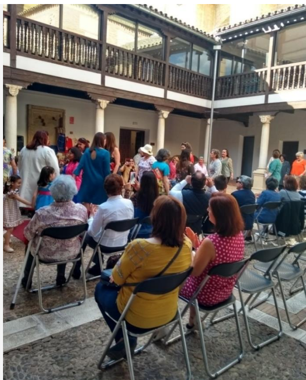
Publico presenciando el desfile de moda organizado por las alumnas de Moda y Diseño

El 17 y 18 de Mayo se ofrecieron las CHARLAS “SENSIBILIZACIÓN EN IGUALDAD DE GÉNERO Y OPORTUNIDADES” , esta charla se impartió por la Técnica de Empleo del Centro de la Mujer en las instalaciones de Cruz Roja, estaba dirigida a personas INCLUIDAS en programas de Asilo Internacional de CRUZ ROJA, sobre Igualdad de Género y Oportunidades y trato sobre los recursos y funciones del Centro de la Mujer. En la misma participaron 27 personas de ambos sexos.