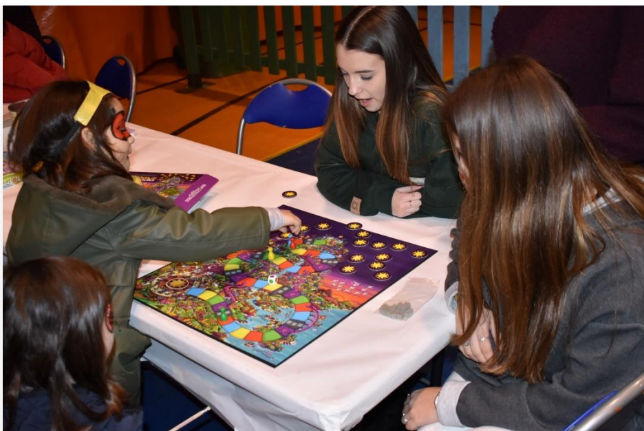
Alta Participación en el taller de Juegos no sexistas