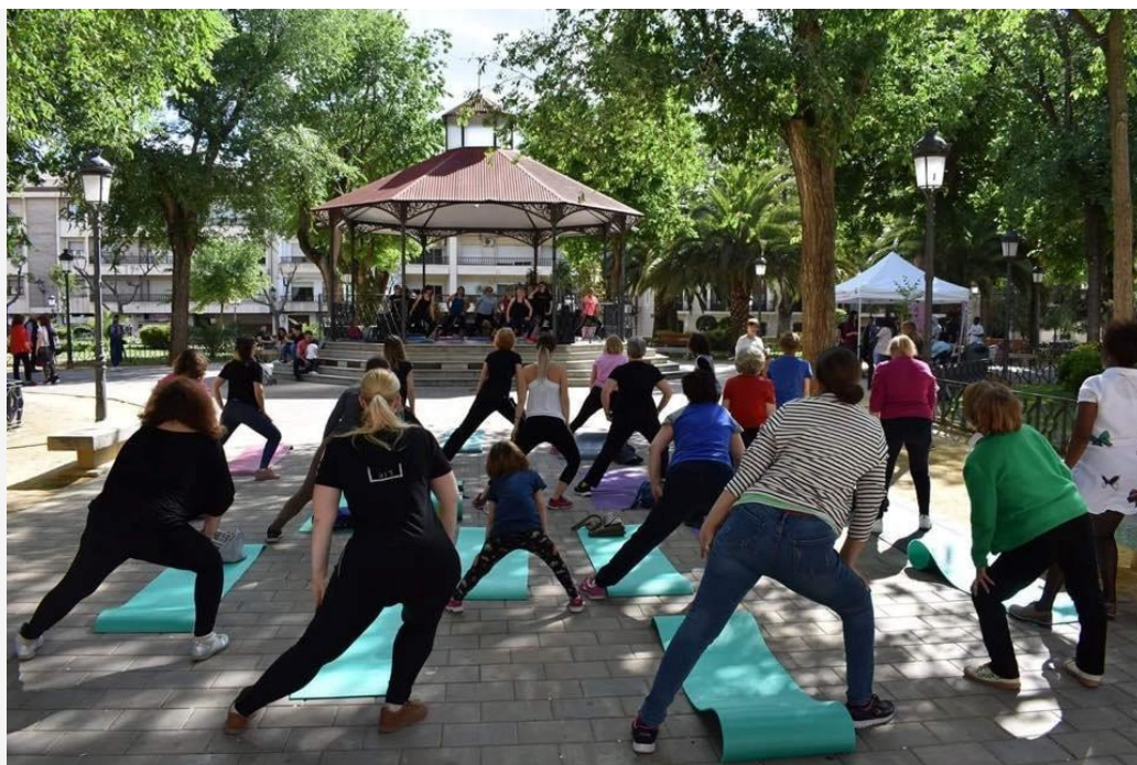
Grupo de Pilates realizando una exhibición en los Jardines del Prado