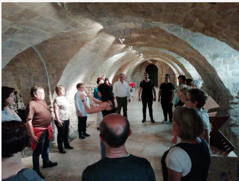
Grupo de Teatro realizando una clase abierta