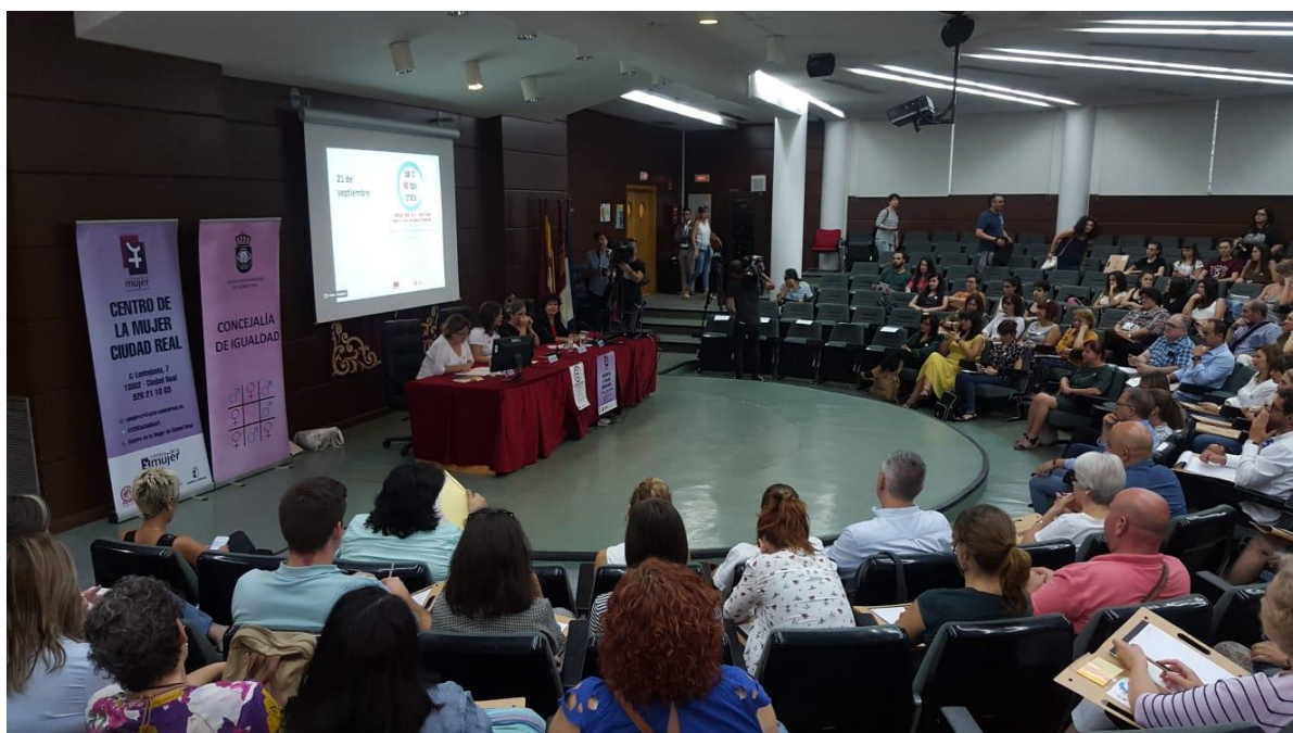
Jornada "Sin ti no hay Trata"