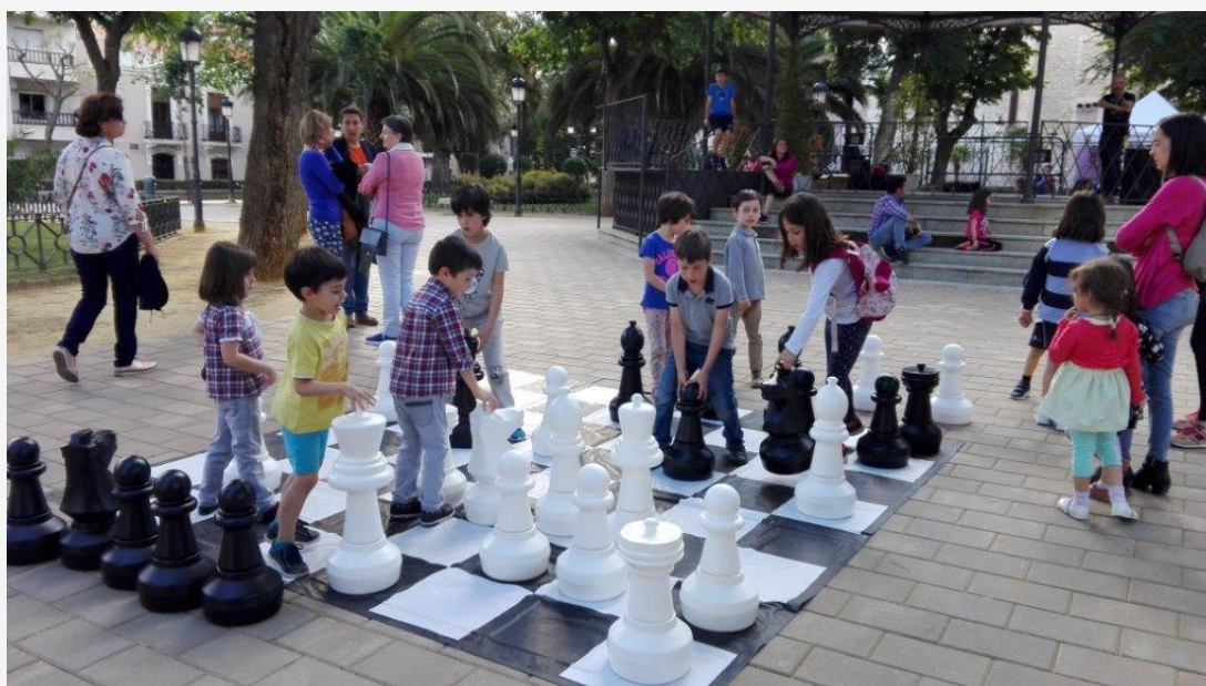
Los niños también participaron en la Celebración de las Jornadas jugando una partida de Ajedrez