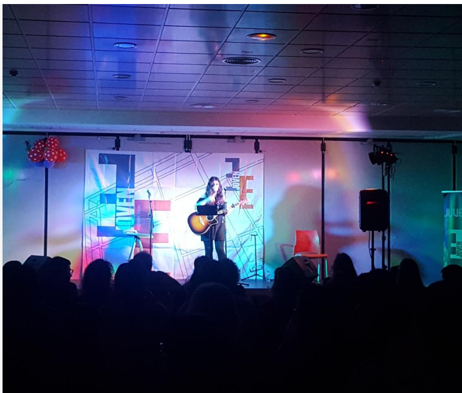
Festival Joven "Con Ellas" Marzo 2018