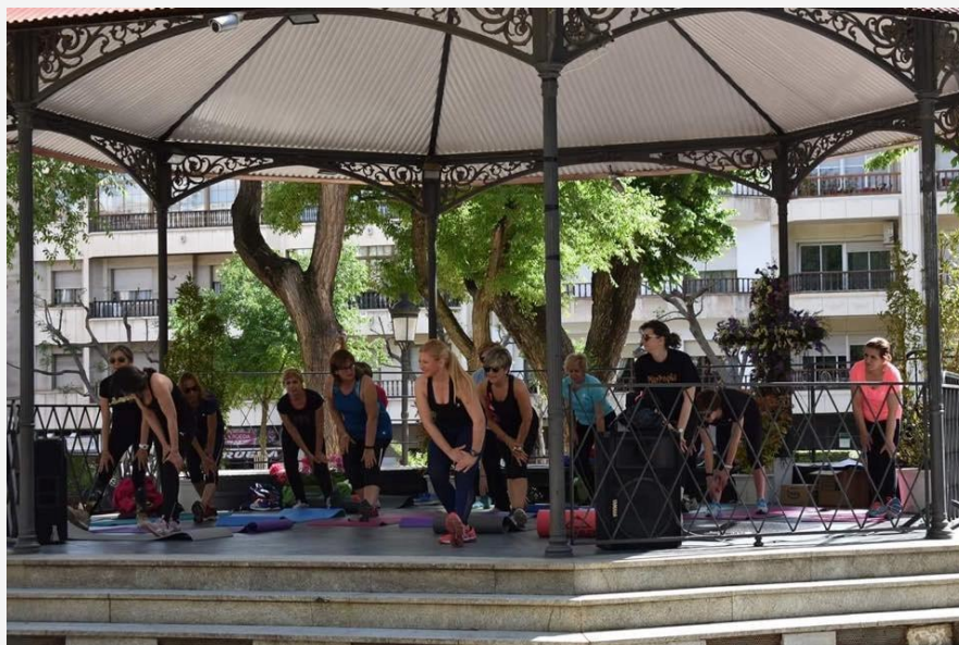
Grupo de participantes realizando el calentamiento durante la celebración de las Jornadas de Clausura

Y desde el 17 hasta el 24 de mayo se exhibió la exposición fotográfica de los trabajos realizados por las alumnas y alumnos del Curso de Fotografía Digital.