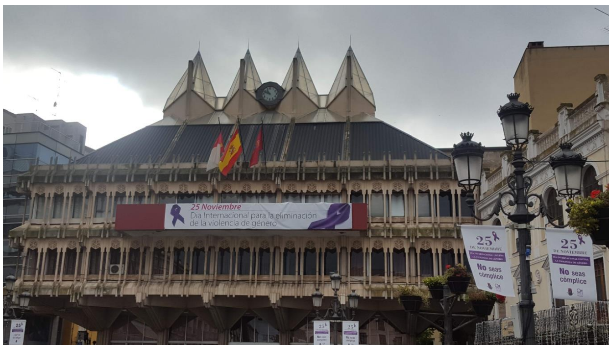
Vista del Ayuntamiento con la Pancarta del Día Internacional para la eliminación de la Violencia de Género