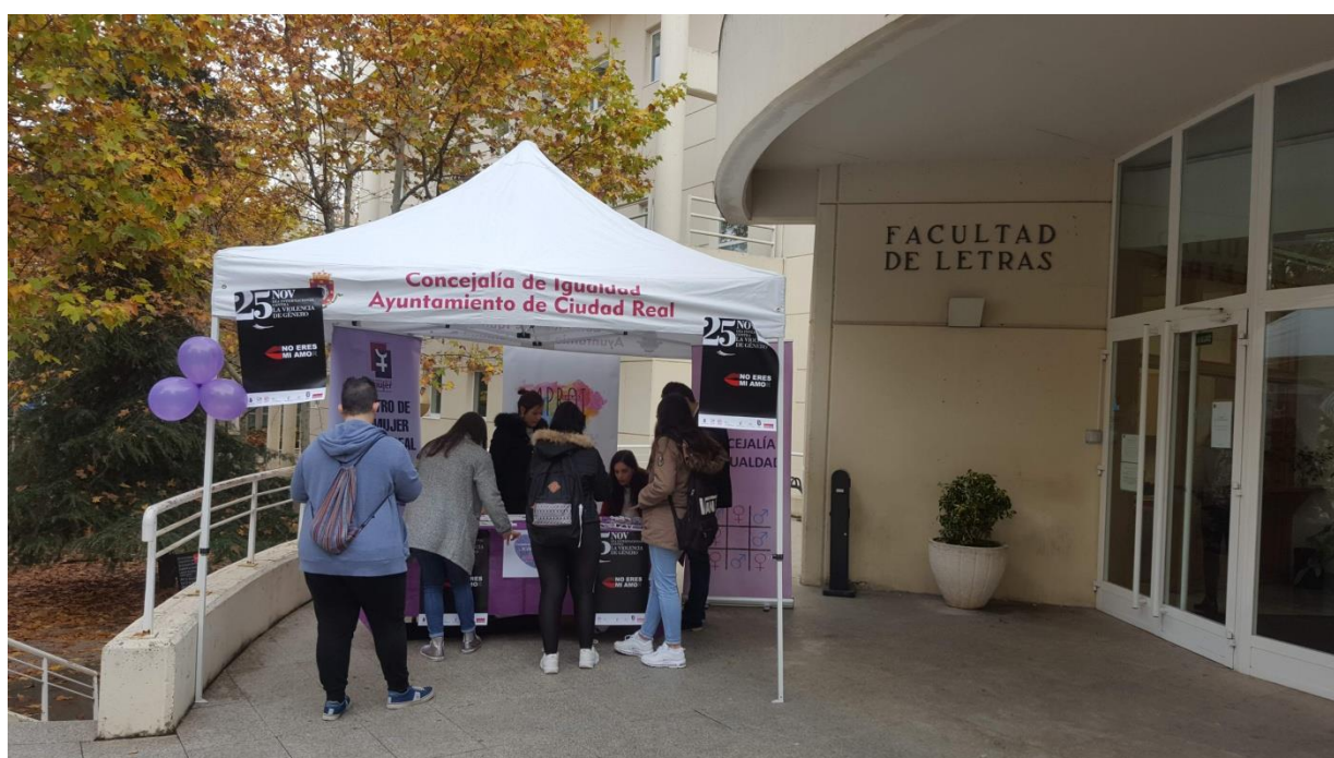
Mesa informativa instalada en la UCLM