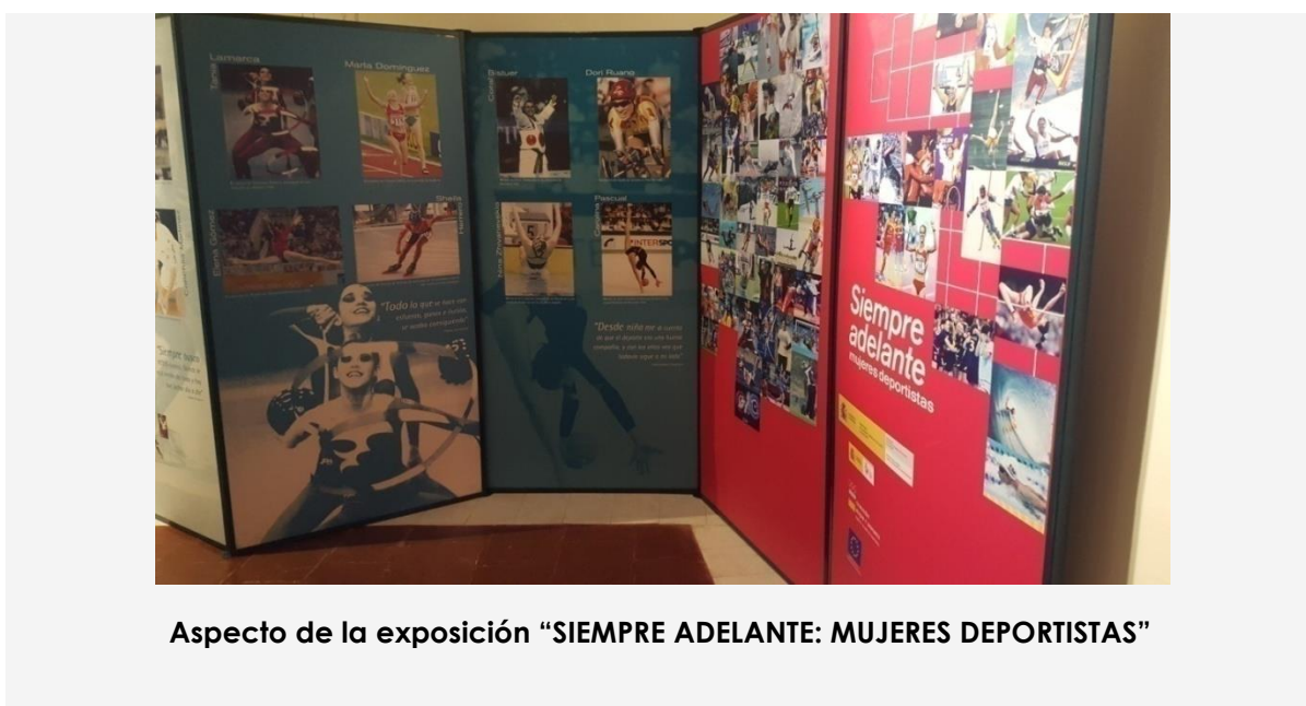
Aspecto de la exposición “SIEMPRE ADELANTE: MUJERES DEPORTISTAS”

Y del 23 de marzo al 8 de abril estuvo expuesta en el Museo López-Villaseñor la exposición “ SIEMPRE ADELANTE: MUJERES DEPORTISTAS ”, cedida por el Instituto de la Mujer. Ministerio de Igualdad, que versa sobre la historia del deporte femenino en España, en la actualidad nuestras deportistas brillan en muchas modalidades, abriendo camino en el cerrado círculo de la práctica deportiva y aunque se avanza a buen ritmo, es necesaria una mayor repercusión de los logros y éxitos de nuestras deportistas. (EJES 4 y 5: EDUCACIÓN Y CULTURA y PARTICIPACIÓN y ACCESO A RECURSOS del II Plan de Igualdad).