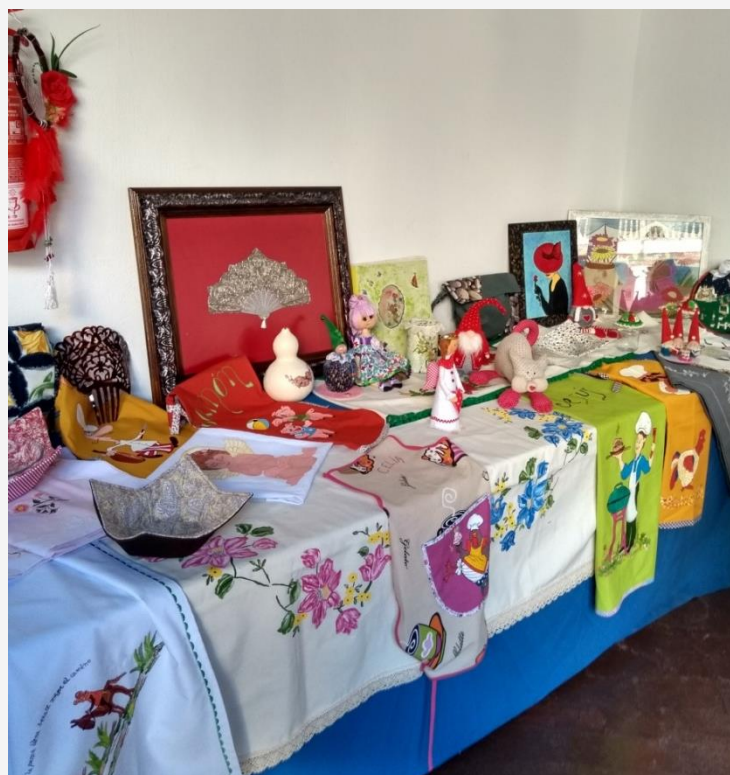
Exposición de los trabajos de manualidades expuesto por las alumnas