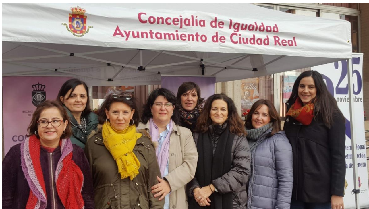
Equipo de la Concejalía de Igualdad durante el Acto conmemorativo del 25 de noviembre