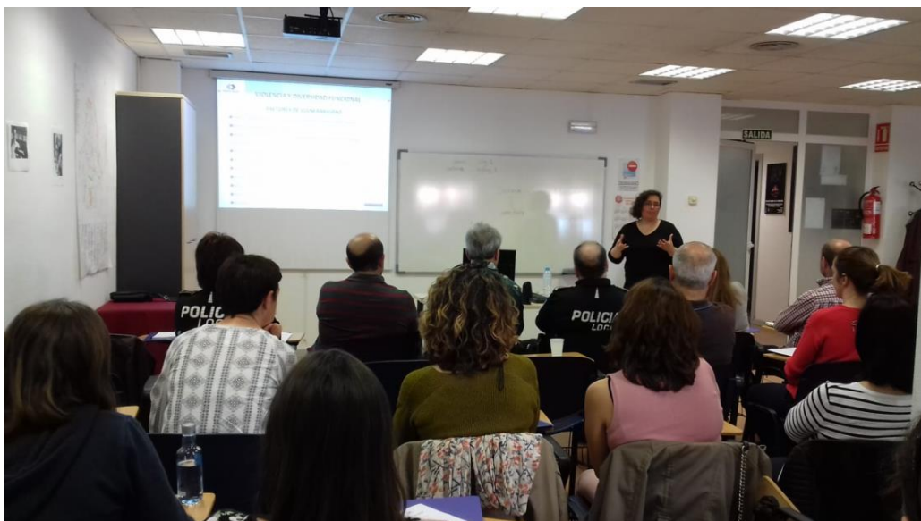
Curso contra la violencia de Género en contextos de Vulnerabilidad

El 24 y 29 de Mayo tuvieron lugar los CAFÉ TERTULIA MARIE CURIE dentro de la programación Mujeres Científicas, en ambas sesiones se visiono la película MARIE CURIE , y posteriormente se realizo un debate sobre la película y se repartió el díptico de Mujeres Nobeles, esta actividad se celebró en el Centro vecinal de las Casas y en el Centro Vecinal de Valverde, participaron 15 personas en las Casas y 12 en Valverde, con una mayoría de mujeres. En esta actividad participaron alumnado en prácticas del Modulo de Igualdad de IES ATENEA. (EJES 4 Y 5 del II Plan de Igualdad)