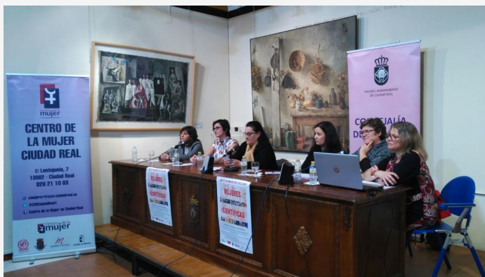
Mesa Redonda “Científicas de nuestro Tiempo”

El 6 de febrero de 2018 tuvo lugar la inauguración de la exposición “ MUJERES CIENTIFICAS, QUÉ SABES DE ELLAS? ”, que se exhibió del 6 al 20 de Febrero de 2018, en el Museo Manuel Lopez Villaseñor, esta exposición especialmente dirigida a la Comunidad educativa, cedida por el Instituto de la Mujer de Castilla La Mancha y que tiene como objetivo visibilizar el trabajo de las científicas, y crear roles femeninos en los ámbitos de la ciencia y la ingeniería y eliminar estereotipos sexistas que influyen en la elección de estudios. La exposición que visibiliza a las mujeres que han contribuido al avance de la ciencia, consta de 38 carteles que abarcan desde la antigüedad clásica hasta nuestros días.