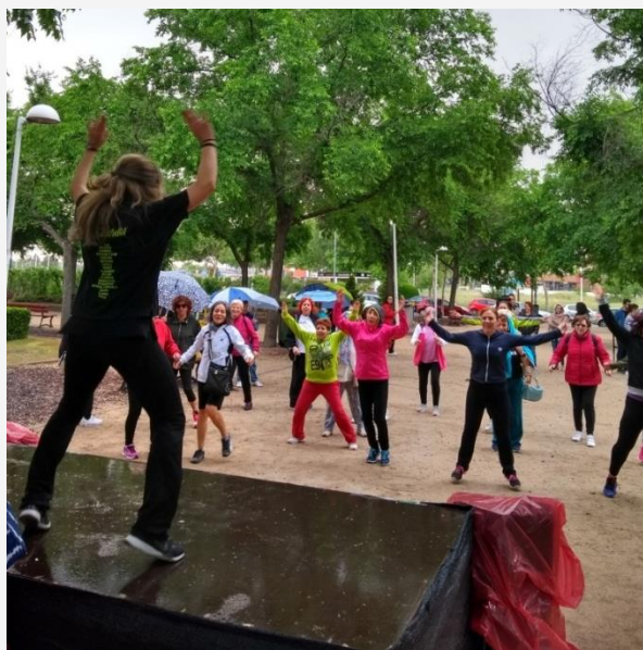
Grupo de participantes en la celebración del día de las Vías Verdes

El 18 de Mayo tuvo lugar la XX CELEBRACIÓN DEL DÍA DE LAS VIAS VERDES , la Concejalía de Igualdad participo en la celebración de este día organizando varias actividades deportivas, Zumba y Baile en Línea, además se repartieron varios obsequios de merchandising entre los participantes, se realizo en las Vías Verdes y tuvo una participación de unas 50 personas. "EJE 6: CALIDAD DE VIDA Y CONCILIACIÓN"