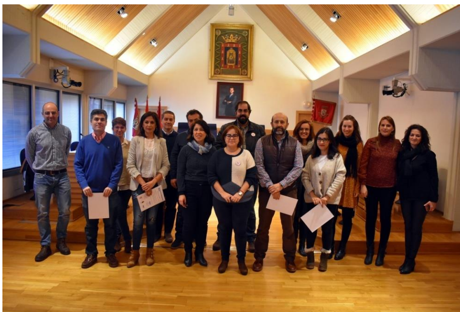
Entrega de diplomas del curso sobre Uso Igualitario del Lenguaje Administrativo

El 30 enero 2018 tuvo lugar la entrega de diplomas del curso sobre EL USO IGUALITARIO DEL LENGUAJE ADMINISTRATIVO , proponiendo un uso más inclusivo del lenguaje , considerando la tendencia de las lenguas a cambiar lo que permite potencialmente una mayor inclusividad social, cuando cierta conciencia social influye sobre los cambios de las lenguas. El curso se destino a personal del Ayuntamiento de Ciudad Real y en el participaron 50 personas de ambos sexos, se impartió en formato online por FISE , con una duración de 15 horas lectivas. (EJES1 y 4 del II Plan de Igualdad)