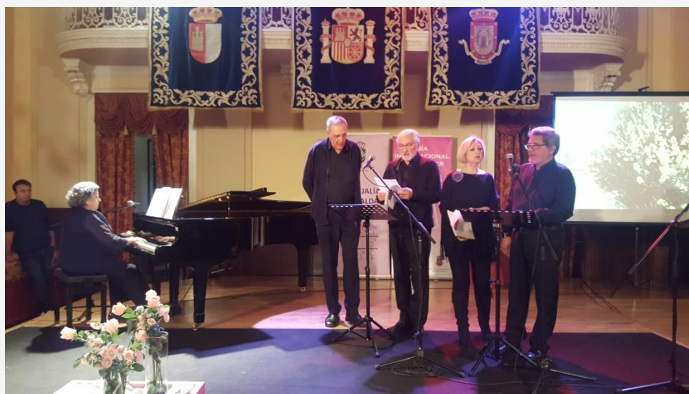
Actuación del Grupo de Recitación Musical del Ateneo "Juan de Ávila" durante el acto institucional del Día Internacional de la Mujer.