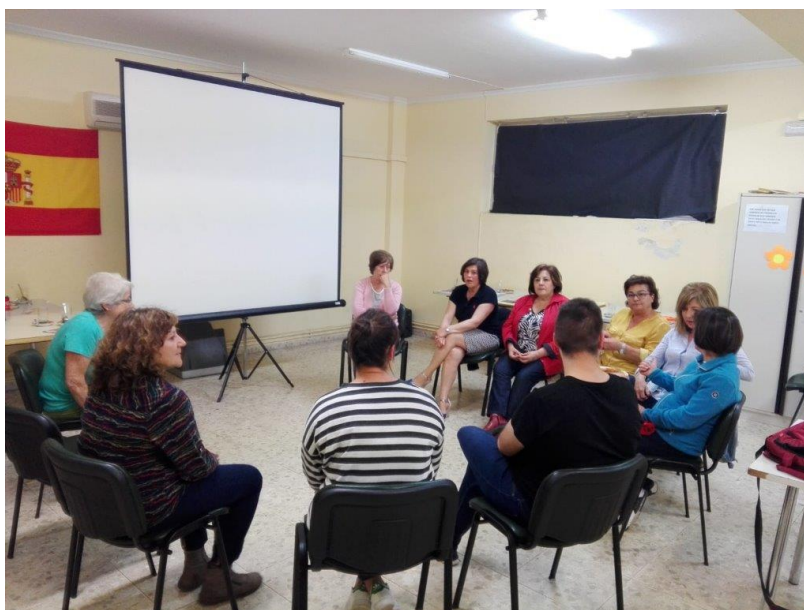
Grupo Café Tertulia en el Anejo de Valverde

El 24 y 29 de Mayo tuvieron lugar los CAFÉ TERTULIA MARIE CURIE dentro de la programación Mujeres Científicas, en ambas sesiones se visiono la película MARIE CURIE , y posteriormente se realizo un debate sobre la película y se repartió el díptico de Mujeres Nobeles, esta actividad se celebró en el Centro vecinal de las Casas y en el Centro Vecinal de Valverde, participaron 15 personas en las Casas y 12 en Valverde, con una mayoría de mujeres. En esta actividad participaron alumnado en prácticas del Modulo de Igualdad de IES ATENEA. (EJES 4 Y 5 del II Plan de Igualdad)