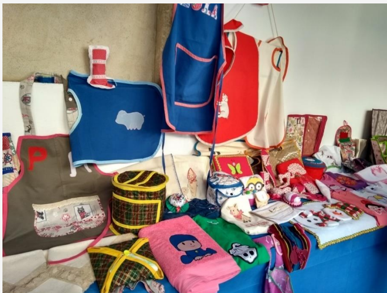
Trabajos realizados por las alumnas de Bordado Creativo

Además en el Museo López-Villaseñor se hizo un desfile de modelos con los trajes diseñados en el Taller de Moda y Diseño, y una demostración del alumnado de Bolillos y otras Labores y Manualidades y Bordado Creativo. EJE 4: EDUCACIÓN Y CULTURA del II Plan de Igualdad).