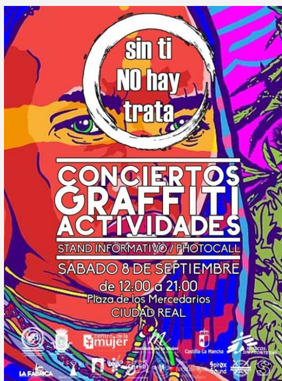
Flyer informativo realizado para la campaña

Pasado el verano se volvió a realizar la campaña " SIN TI NO HAY TRATA ", el 8 de Septiembre se instaló un STAND INFORMATIVO en la Plaza de los Mercedarios donde se ofrecían folletos informativos, también se realizaron varias actividades como un concierto, graffitis y actuaciones. (EJE 3: PREVENCIÓN DE LA VIOLENCIA DE GENERO del II Plan de Igualdad)