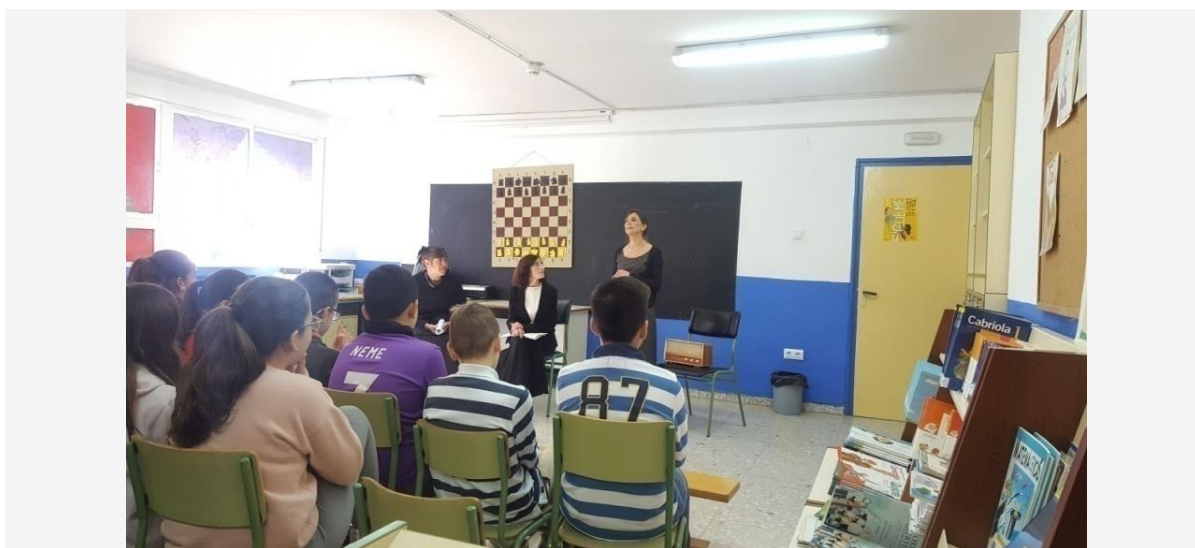
Alumnado participando en la II SEMANA “POR UNA EDUCACIÓN EN IGUALDAD”