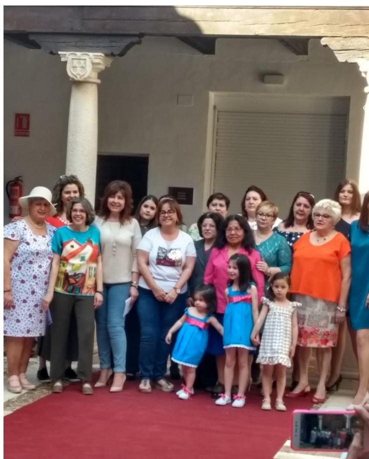
Broche final del desfile de Moda y Diseño