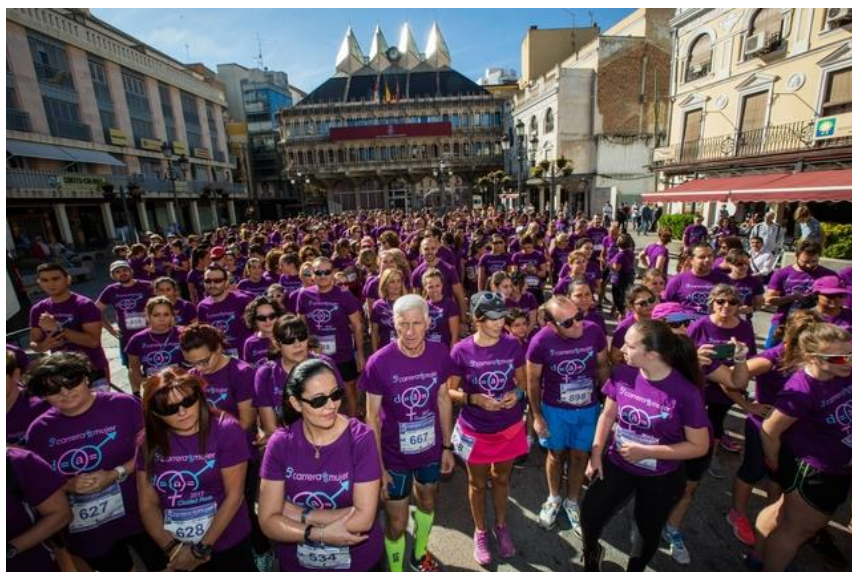
Participantes en la VI carrera de la mujer antes de la salida

El 27 de Abril se realizó una excursión a Madrid, por la mañana se efectuó la visita a los jardines del Retiro y posteriormente a la EXPOSICIÓN “SOROLLA Y LA MODA” sobre la influencia de su pintura en la moda, en el Museo Thyssen Bornemisza y por la tarde se acudió a la representación de TEATRO “EL REENCUENTRO” en el teatro Maravillas, participaron en la excursión 59 personas de ambos sexos. EJE 4: EDUCACIÓN Y CULTURA del II Plan de Igualdad).