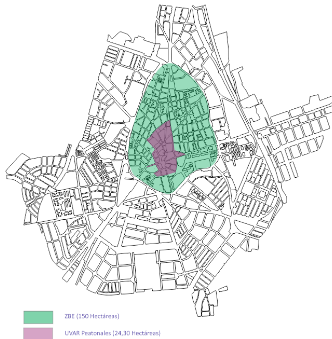
Zona de Bajas Emisiones (ZBE) y UVAR Peatonal de Ciudad Real

Se delimita el interior de rondas de Ciudad Real como una Zona de Bajas Emisiones (ZBE). El área de bajas emisiones tiene una superficie de 150 hectáreas (1,50 km 2 ). En el interior de la ZBE, se distingue una sub zona peatonal (UVAR Peatonal) coincidente con el ámbito y entorno del casco antiguo, permitiendo el acceso autorizado a esta última zona a los residentes en dichas calles, y acceso para la distribución urbana de mercancías en horario específico con distinción de la categoría de homologación, MMA y otros datos del vehículo, según DGT.